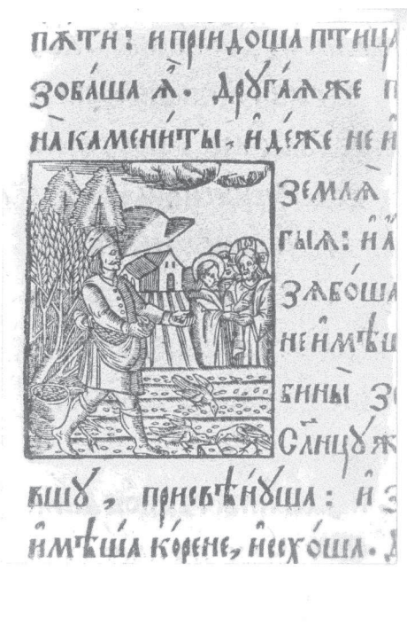
Рис. 2. «Притча про сіяча» з Євангелії, надрукованої у Львові у 1632 р.

Як ми побачили, переважна частина кириличних книг, використовуваних сербами в Угорському королівстві, була Західно-українського походження, отже необхідно познайомитися з ситуацією книгодрукування на цих територіях. Якими були обставини книгодрукування в Західній Україні та Білорусі в XVII–XVIII ст.? Найкраще буде звернутись до студій акад. Ярослава Ісаєвича, який нещодавно пішов із життя, результати досліджень якого дозволяють переосмислити все, що ми знали про цю тему. Друкарні в Україні належали громадянським об'єднанням, так званим братствам, і це була головна відмінність між білоруськими та українськими друкарнями та царським «Печатним двором» у Москві [62; 66]. Крім того, вони стояли ближче до польської території та культури як в географічному, так і в духовному сенсі. Хоча зміст богослужбових книг був строго визначений у візантійському обряді, а в передмовях були можливості для імпровізацій, і навіть ілюстрації були інструментами для завоювання нових клієнтів, принаймні мали привернути їхню увагу. Бароко 18-го століття, поза сумнівом, було знайомим ілюстраторам богослужбових книг, випущених у Західній Україні. Передмови та післямови додавалися у західних